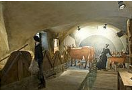
Musée de Saint Martin, 150 ans d'histoire d'une haute-vallée de Savoie