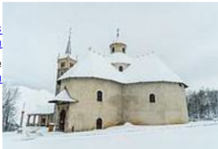
Sanctuaire ND-de-la-Vie (St-Martin-de-Belleville)

Situé au cœur du village, dans un ancien corps de ferme, le Musée retrace 150 ans d'histoire de cette haute vallée savoyarde. Une histoire étonnante qui mena ce village d'altitude, vivant en quasi autarcie, vers un destin touristique.